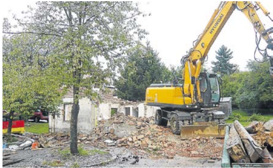
... und sein Abriss.