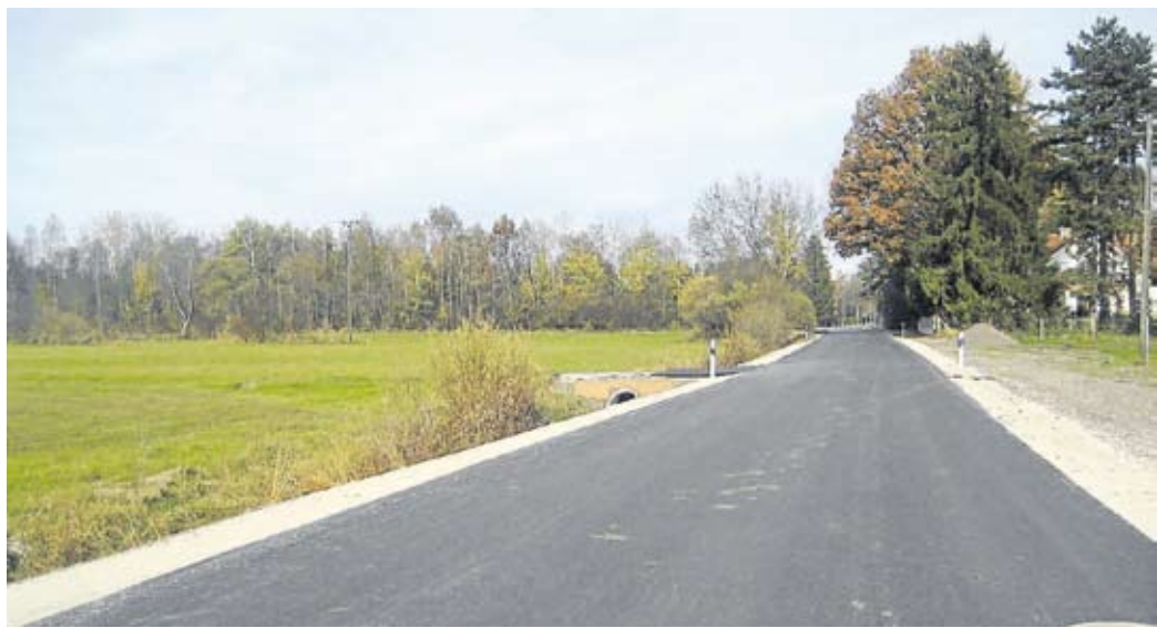
Die neu ausgebaute Estinger Straße in Palsweis-Moos.

In der Schule waren eine komplette Bodensanierung und umfangreiche Malerarbeiten notwendig. Außerdem musste die Oberlichtenverglasung in der Aula wegen Undichtigkeit erneuert werden. Im Rathaus war eine Sanierung von drei Büroräumen wegen Feuchtigkeit im Mauerwerk unumgänglich. Nach nur 6 Monaten Bauzeit konnte im Juni der neue Gewerbebau in Günding an die Mieter übergeben werden. Da die Gemeinde auf erneuerbare Energien setzt, wurde das Gebäude mit einer Photovoltaikanlage versehen und die Möglichkeit zum Anschluss an die Fernwärmeversorgung ist bereits vorgesehen. Es war das erste Projekt des neugegründeten Kommunalunternehmens EWG Bergkirchen.