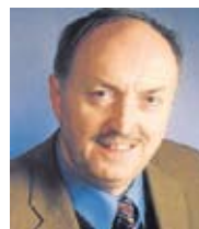
Simon Landmann, 1. Bürgermeister

gang mit den Steuergeldern sind wir weiterhin in der Lage, dringend anstehende Verbesserungen in den Bereichen Kinderbetreuung, Jugend, Schule, Kanalbau, Klimaschutz sowie bei der Verkehrssicherheit durchzuführen. Besonders der Geh- und Radwegeausbau, der Bau unseres Kinderhauses, die Verbesserung des öffentlichen Nahverkehrs und das Thema Klima (Windkraft) und Energie (Ausbau des Fernwärmenetzes) werden uns im kommenden Jahr stark beanspruchen. Kulturell wird das Jahr 2012 anlässlich des 10-jährigen Bestehens des Agenda Arbeitskreises „Kultur und Begegnung“ ein außergewöhnliches Programm bringen. So wird am 7. Juli 2012 die Rat-