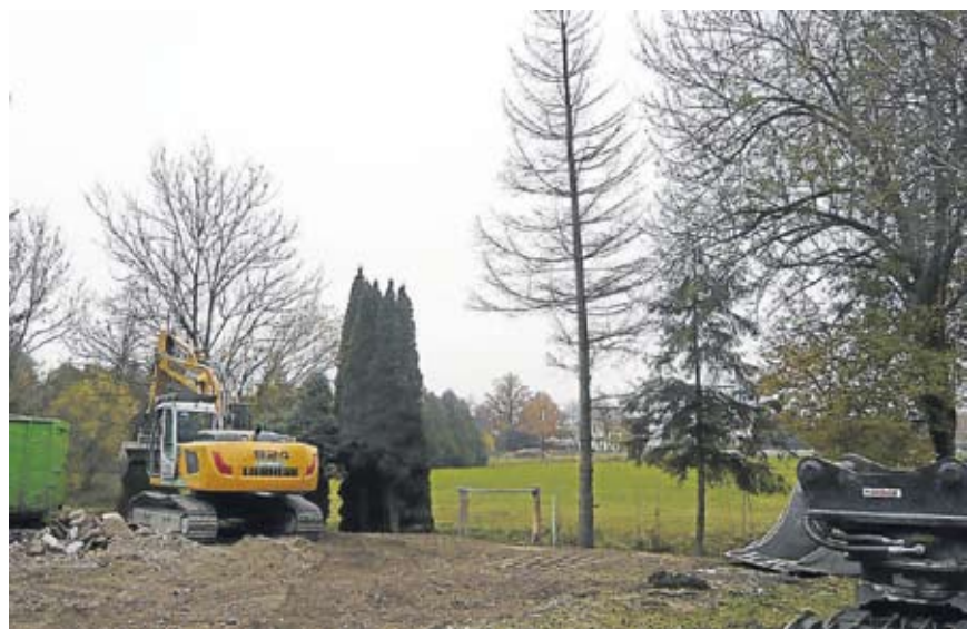
... und der Abriss der „Baracke“.