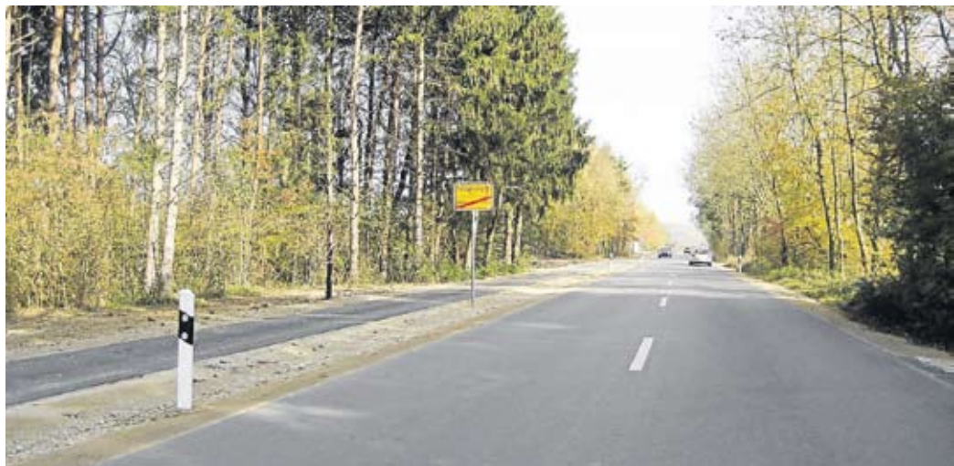
Die Gemeindeverbindungsstraße von Feldgeding ins Gewerbegebiet GADA mit Geh- und Radweg.

Wie bereits erwähnt wurde die Fernwärmetrasse vom Gewerbegebiet GADA Richtung Feldgeding bereits gebaut. Das für die Fernwärmelieferung notwendige Pumpenhaus wurde vor ein paar Wochen im GADA aufgestellt.