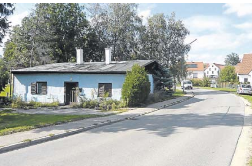
Die „Baracke“ in Günding...

den und parallel dazu soll der Ort Bergkirchen mit Fernwärme versorgt werden (Ziel ist die Schule und das neue Kinderhaus). Der erste Bauabschnitt für die Sanierung des alten Schulhauses Fortsetzung auf S. 5