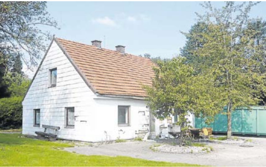
Das alte Gemeindehaus in Eisolzried...