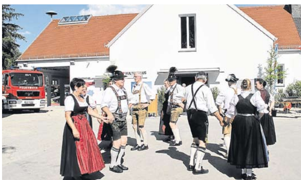
Die „Eschenrieder Tanzmusi“ vor dem renovierten Kulturhaus.