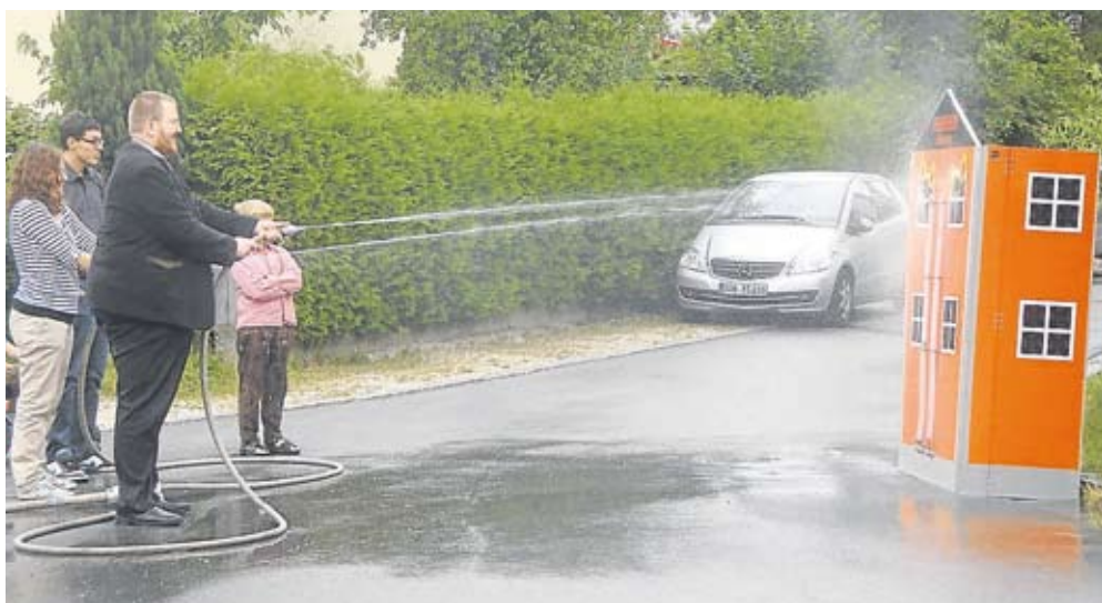
Feuerwehrfest Auch die Feuerwehr Kreuzholzhausen veranstaltete ein Dorffest, bei dem nicht nur die Kinder ihren Spaß hatten.