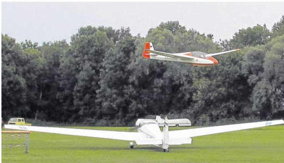
Flugfest Zu dem jährlichen Flugfest des Aero-Clubs kamen heuer ca. 700 Besucher auf das Fluggelände in Gröbenried, um die Starts und Landungen zu beobachten und um Kaffee und Kuchen oder Spezialitäten vom Grill zu genießen.