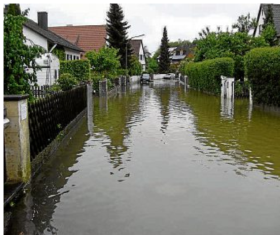
Die Bulachstraße in Günding glich einem Fluss.