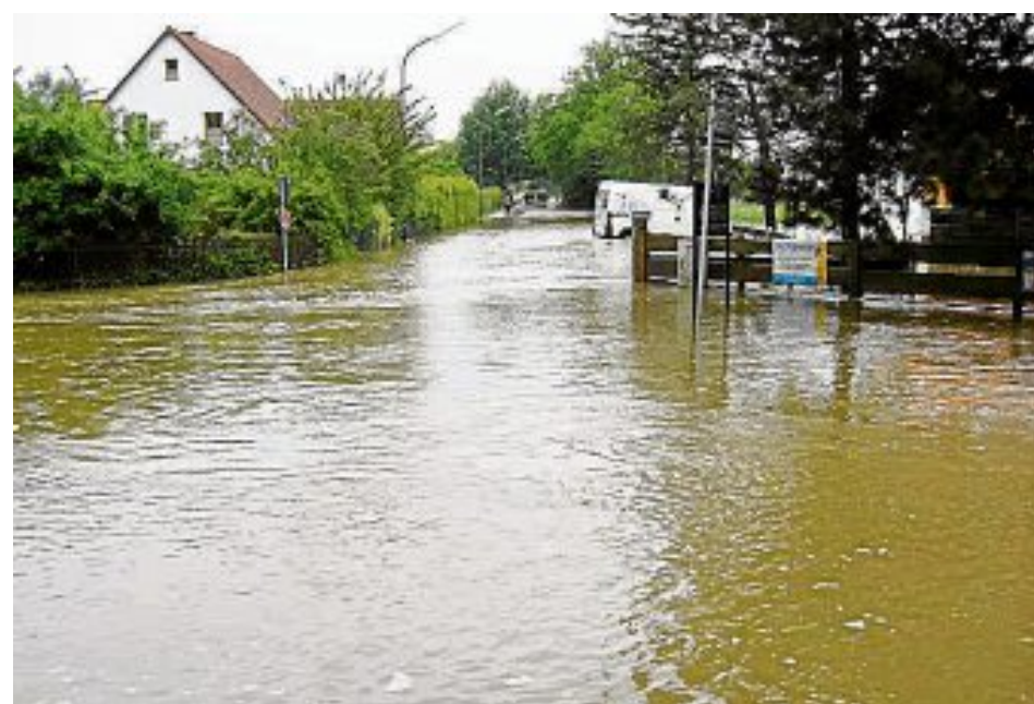
Überflutet: Die Zufahrt zu Sportheim und Kindergarten.