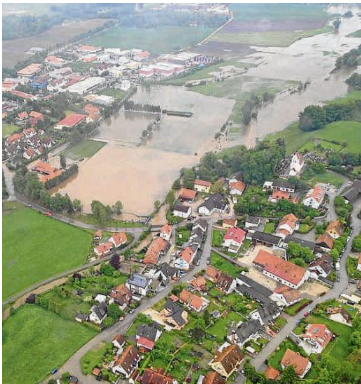
Das Sportgelände von Günding glich einer Seenlandschaft.