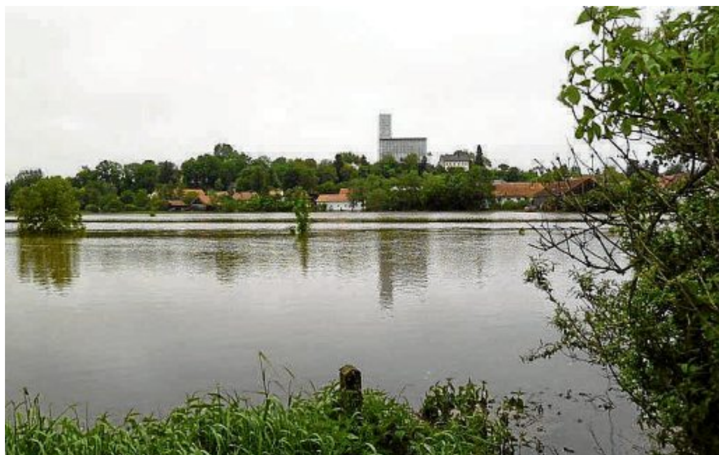
Auch in Bergkirchen hieß es „Land unter“.

sicherungen, Staatsregierung und Finanzämter in ihrem Ermessen den Geschädigten entgegen kommen. Alle ehrenamtlichen Helfer wurden durch den Landkreis am Donnerstag, 27. Juni 2013 vor Beginn des Karlsfelder Siedlungsfestes zu einem Ehrenabend ins Bierzelt eingeladen.