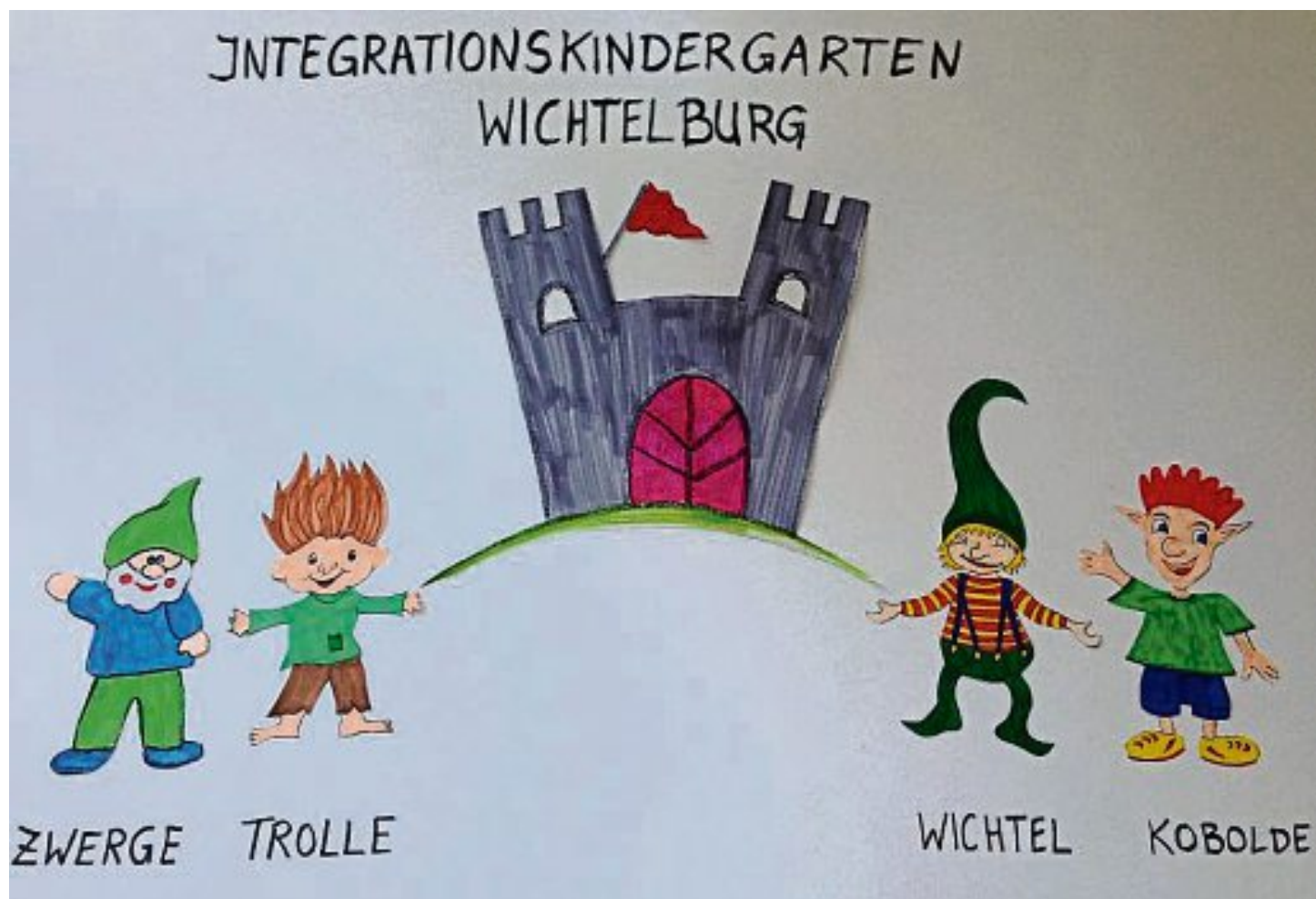
Das neue Logo der Wichtelburg mit den neuen Gruppennamen.

Auf dem Weg zurück mussten die Kinder genau aufpassen, denn eine Polizistin hatte in ihrem Verhalten Fehler eingebaut, die aber von den Vorschulkindern alle ganz schnell mit einem lauten „Stopp“ erkannt wurden. Zum Abschluss wurde uns noch gezeigt, was alles in einem Polizeiauto drin ist und für was es gebraucht wird. Natürlich wurden auch das Blaulicht und das Martinshorn angeschaltet. Ein besonderes Erlebnis war dann noch, dass sich jedes Kind ins Polizeiauto setzen durfte.