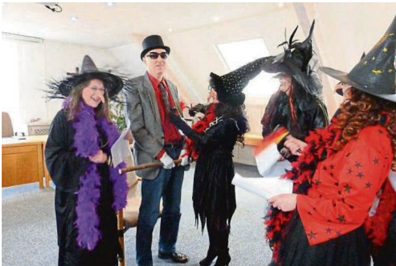
Machtübernahme Wie jedes Jahr übernahmen am „Unsinnigen Donnerstag“ die Hexen im Rathaus die Macht. Der Bürgermeister musste den Schlüssel übergeben und seine Krawatte war natürlich auch nicht vor der Schere der wilden Damen sicher. Zur allgemeinen Belustigung trickste der Rathauschef dieses Mal die Damen mit einer Metallverstärkung in seiner Krawatte aus, was jedoch die zuständige Hexe nicht davon abhielt, die Krawatte trotzdem zu zerstören.