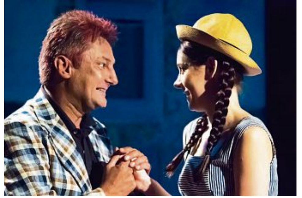
... aber Sigismund verliert sein Herz an Klärchen, Professor Hinzelmanns Tochter

Die Gemeinde Bergkirchen bedankt sich nochmals auf diesem Wege bei allen Beteiligten für dieses einmalige Erlebnis.