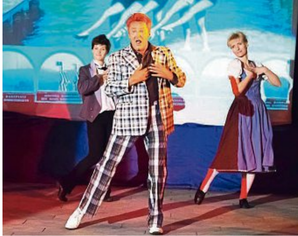
Der „schöne Sigismund Sülzheimer“ trifft im „Weissen Rössl“ ein und verzaubert mit seinem Charme alle Frauen...