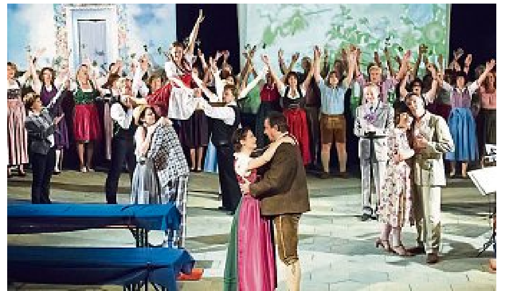
Am Schluss wird „Sepherl“ klar, dass doch Leopold der Richtige ist.