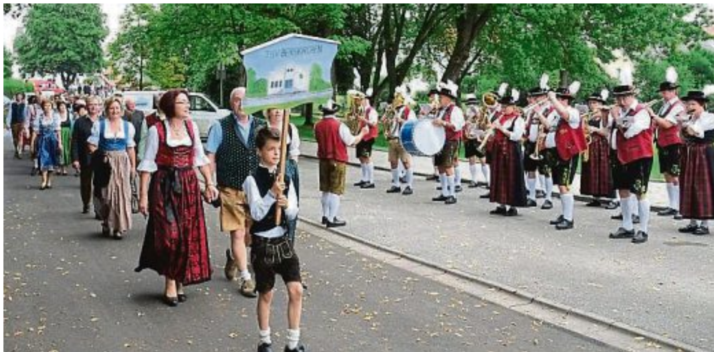
Festzug durch Bergkirchen.