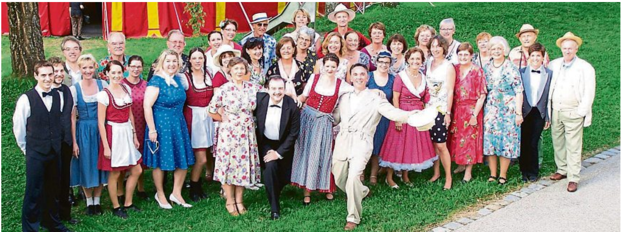
Das gesamte Ensemble mit dem Jubiläumschor.