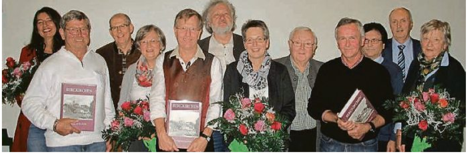
Die Vorstellung der Dorfchronik Bergkirchen.