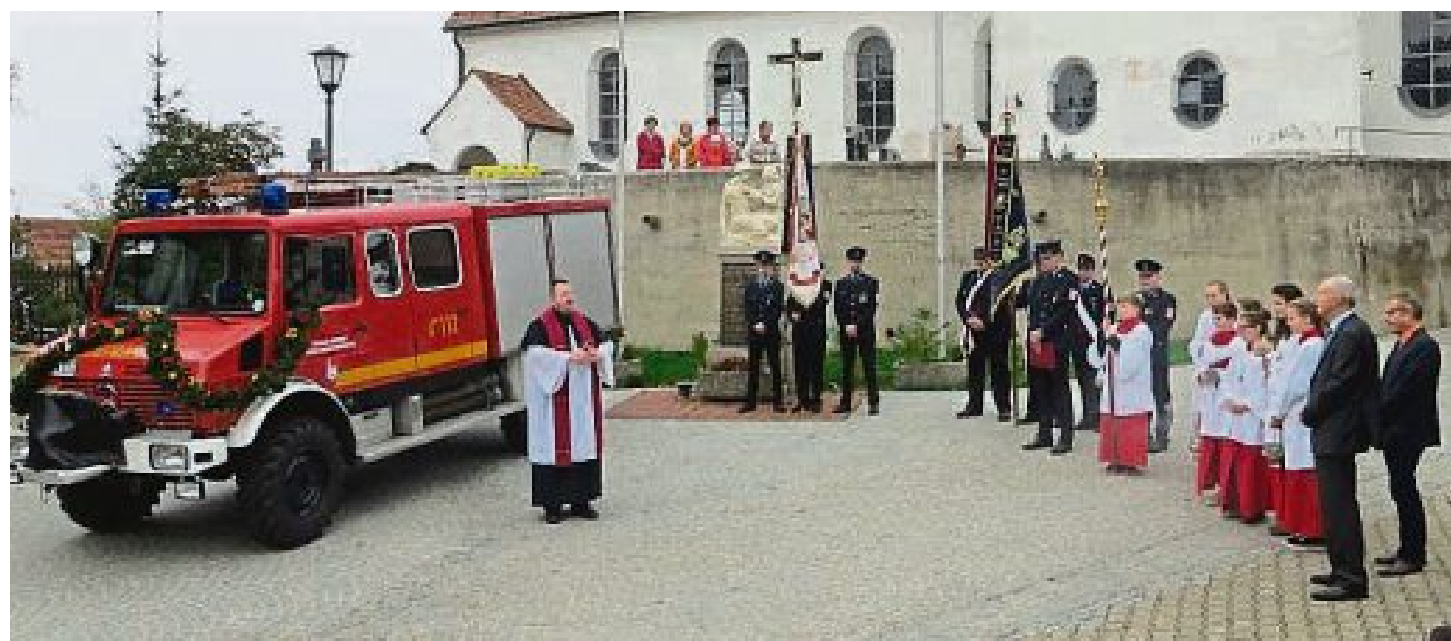
Fahrzeugweihe bei der Feuerwehr Kreuzholzhausen.

Die Planung zu einem weiteren Geh- und Radweges zwischen Eisolzried und dem Eisolzrieder See sind bereits im Gange. Auch zwischen Lauterbach und Priel soll vom Landkreis ein neuer Geh- und Radweg gebaut werden. Die Gemeinde hat auch hier den Grunderwerb organisiert. In Neuhimmelreich vom Badeseer bis zur Brücke über die B 471 wird ebenfalls ein Geh- und Radweg errichtet. Bei allen drei Projekten gab es keine Schwierigkeiten, die erforderlichen Flächen zu bekommen. Nochmals danke an alle Grundstückseigentümer. ■