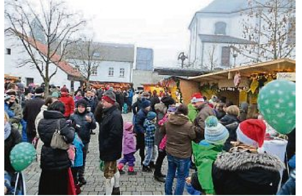
Der Adventsmarkt zog viele Besucher an.