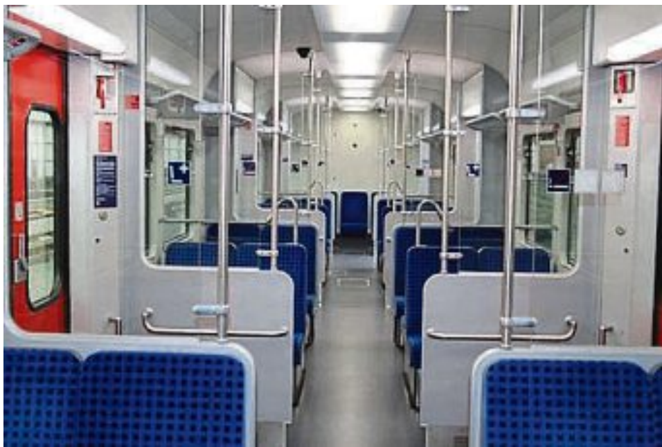
Innenraum ET 420 -modernisiert.

In der Hauptverkehrszeit werden neben den bekannten Münchner S-Bahnen der Baureihe ET 423, auch Fahrzeuge der Baureihe ET 420 eingesetzt. Die ET 420-Fahrzeuge wurden vor ihrem Einsatz sowohl innen als auch außen aufwendig modernisiert und unter anderem mit Videoeinrichtungen und Rollstuhlrampen ausgestattet.