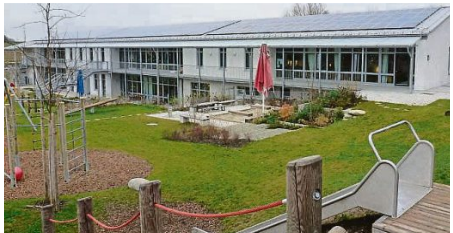
Das Kinderhaus mit seiner Photovoltaikanlage.