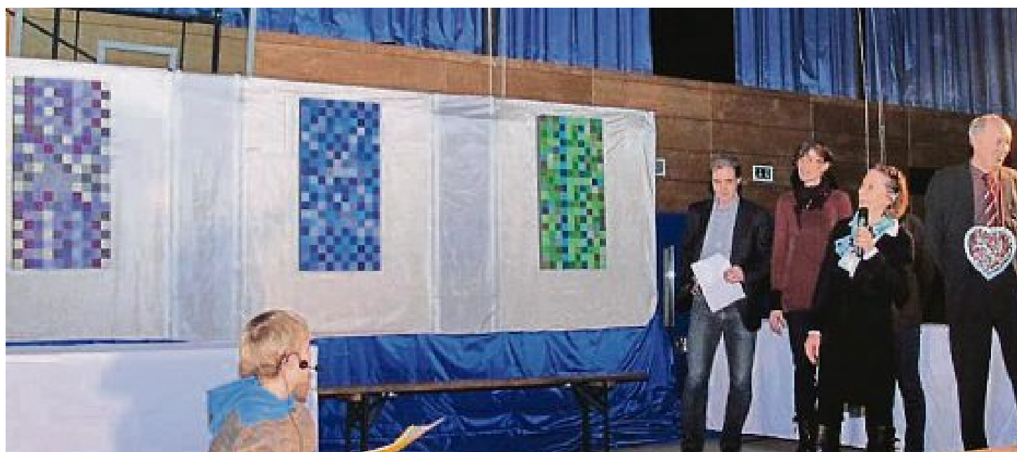
Geschenk für die Gemeinde zum 1200-jährigen Jubiläum: Sechstelliges Mosaik.