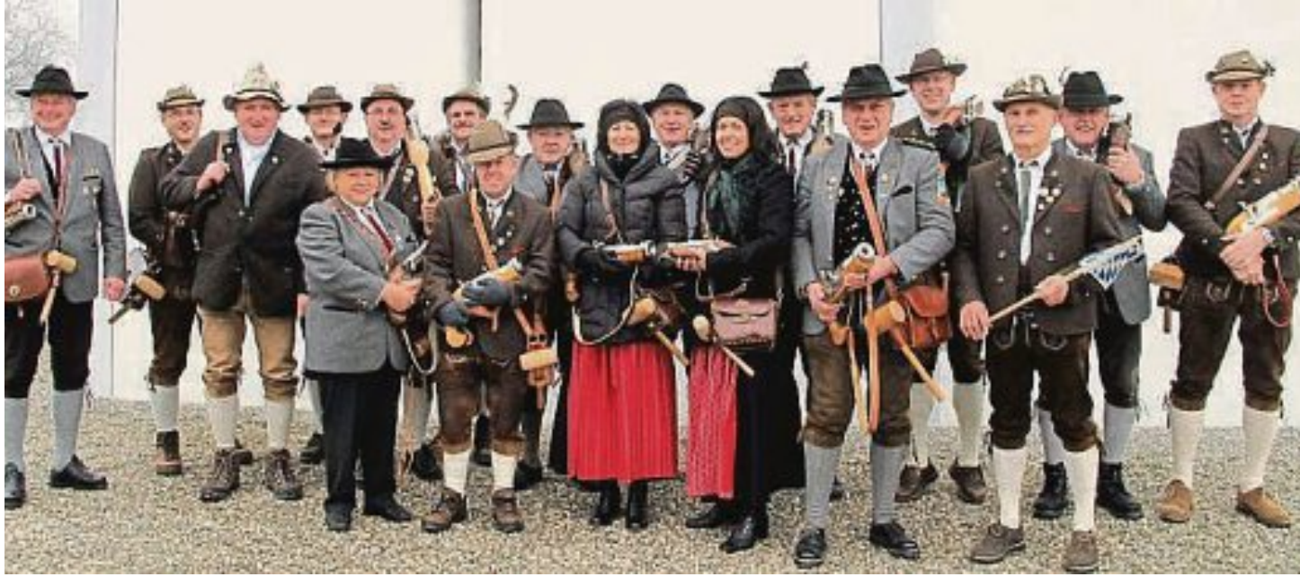
Die Böllerschützen gaben den Startschuss.