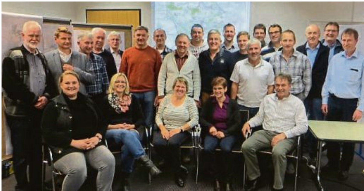
Klausurtagung des neuen Gemeinderates.