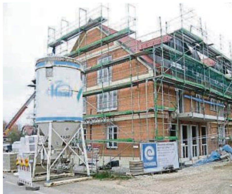
Das alte Bruggerhaus wurde abgerissen.

wurde außerdem das Brandschutzkonzept überarbeitet sowie ein neuer Aufenthaltsraum für das Personal gestaltet. Das Kinderhaus Regenbogen in Bergkirchen wurde im Mai mit einem gro-