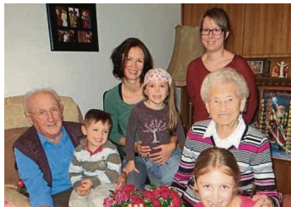
... und heute im Kreise der Familie.