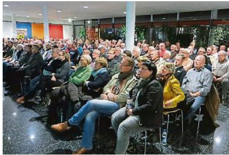
Die Bürgerversammlung war gut besucht.

Da die Krisenherde in aller Welt nicht weniger werden und die Flüchtlingsströme nicht abreißen, sind auch wir verpflichtet Hilfe zu leisten. Derzeit sind in unserer Asylunterkunft in Gröbenried 49 Flüchtlinge darunter 10 Kinder (6 Säuglinge) unterge-