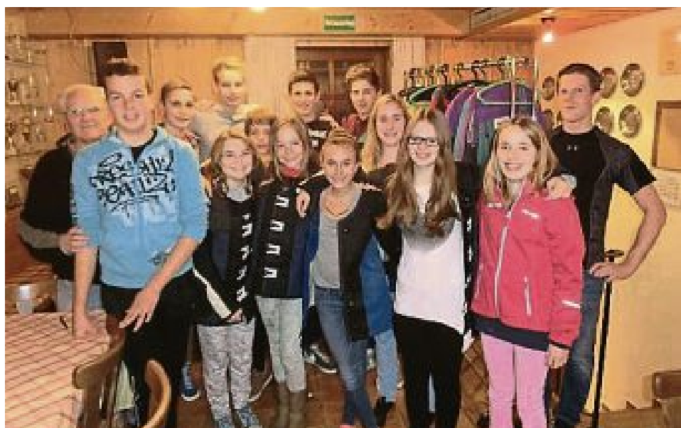
Schützenverein Hubertus Bergkirchen.