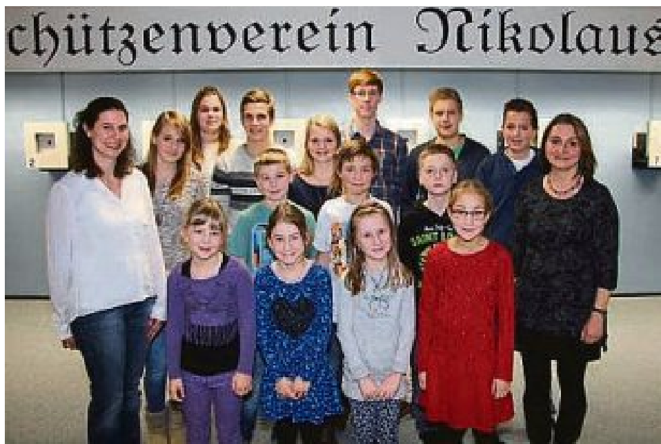
Schützenverein Nikolaus Deutenhausen.