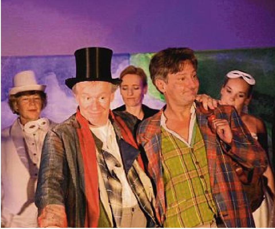
Schuster Knierim und Schneider Zwirn: Beiden hat das Geld kein Glück gebracht.