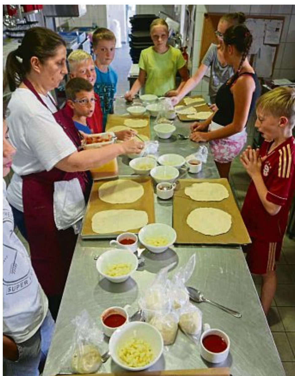
Pizzateig selbst machen, backen und essen.

Kurse am 12. September, im Rahmen des Tags der offenen Tür im Kulturhaus Eschenried und am 13. September treten Bianca und ich gegen Vertreter der Bergkirchner Vereine beim „Schlag die Jugendpfleger“ in der Sporthalle an. Sich dieses Spektakel anzusehen und mitzuerleben ist jeder herzlich eingeladen! Wer weitere Ideen und Vorschläge für die Angebote des Ferienprogramms 2016 hat, kann mir gerne Mailen bockermann@kjr-dachau.de oder anrufen unter 0172-5808023. (Gemeindejugendpfleger Johannes).