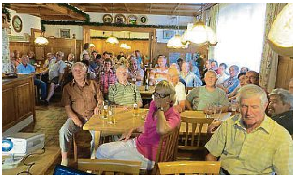
Gut besucht: Bürgerversammlung in Lauterbach.