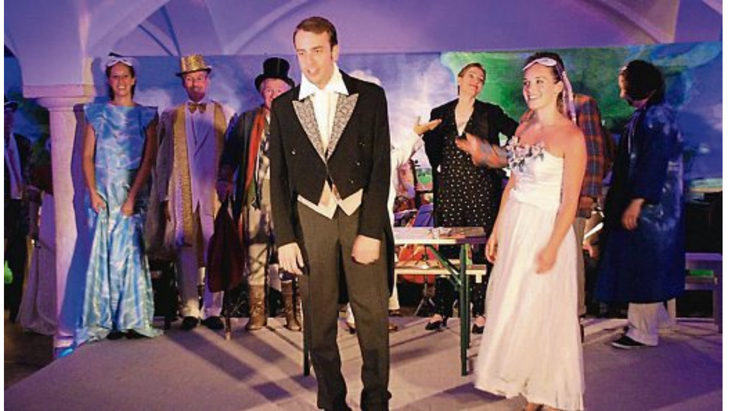
Die Ehe von Tischler Leim wird nicht glücklich.