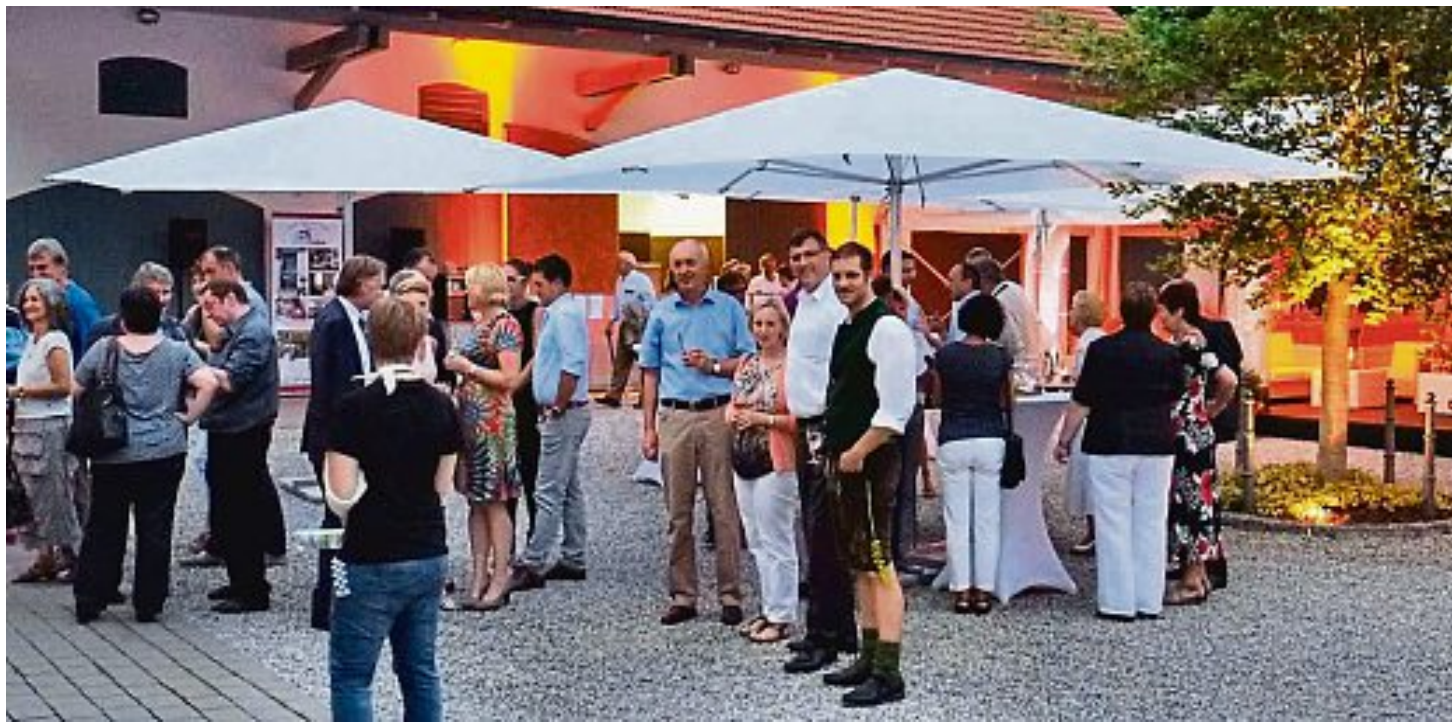
Das Ambiente im Reischlhof in Unterbachern.

Es waren rundum gelungene Theaterabende und alle Gäste freuen sich schon heute auf den nächsten Musikalischen Theatersommer im Jahr 2016.