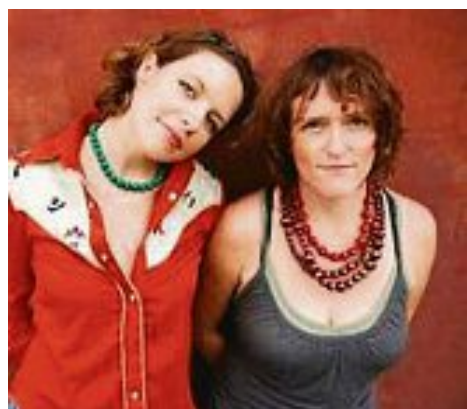
The Hussy Hicks.

In Zusammenarbeit mit der Deutsch-Israelischen Gesellschaft München. Sonntag, 08. November 2015 18:00 - 20:00 Uhr (Einlass 17:00 Uhr mit Bewirtung) Bürgerhaus Palsweis, St.-Urban-Str. 28 Ticket: 15,- € (Abendkasse: 18 Euro)