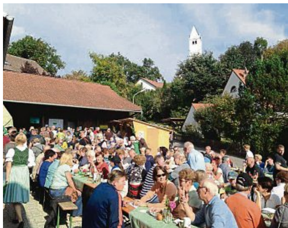
Jede Menge Besucher kamen zum Müllerhof.

Es wurde bewusst dieser Standort gewählt, da die notwendige Infrastruktur hier vorhanden ist. Der öffentliche Nahverkehr, die Einkaufsmöglichkeiten und die Kinderbetreuung sowie evt. Arbeitsmöglichkeiten waren ein weiteres Argument für diesen