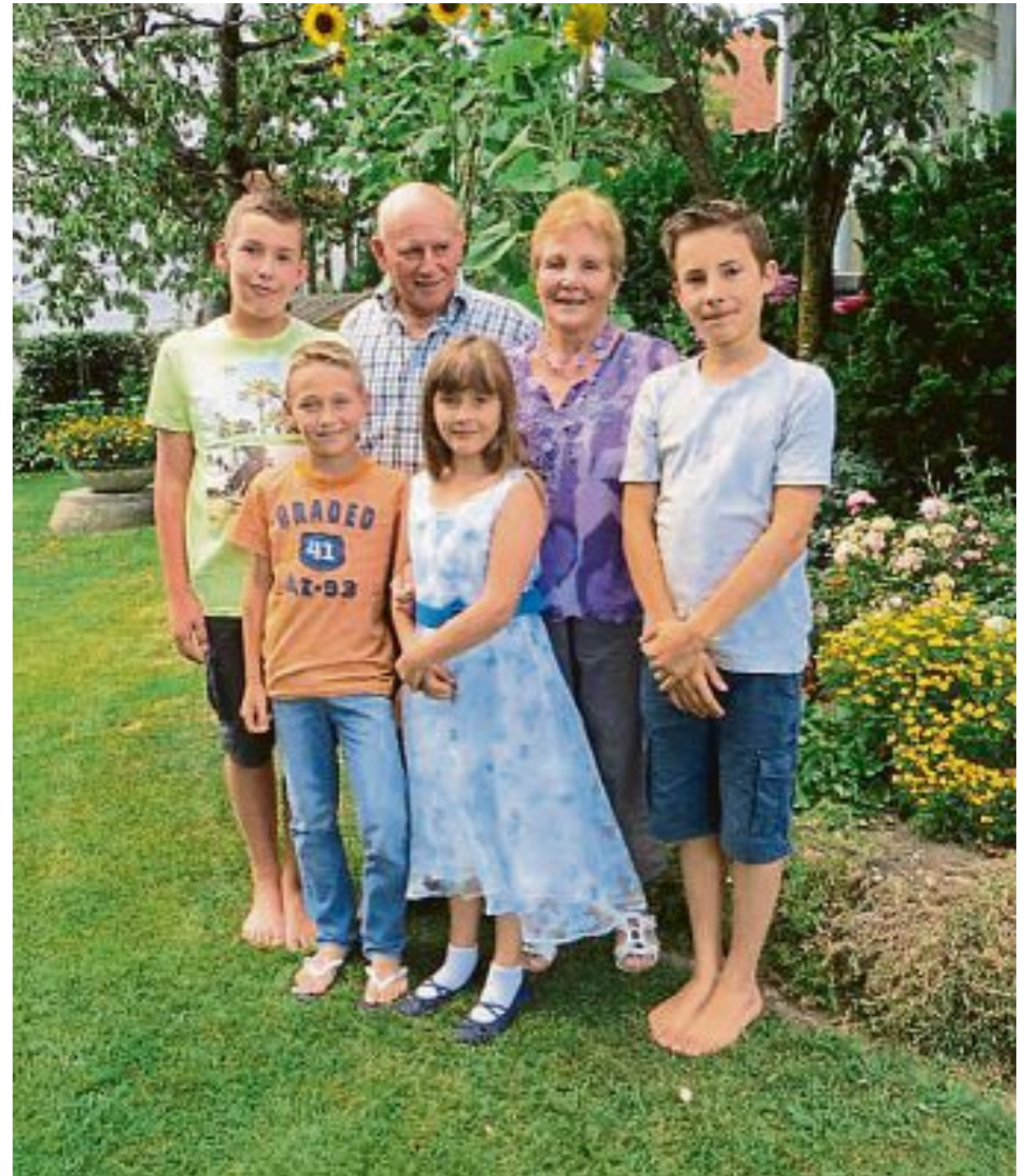
sie seit 2001 in Palsweis Mesnerin. Auf dem Foto ist das Jubelpaar mit seinen vier Enkelkindern zu sehen.