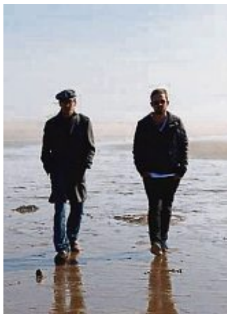
The Portnoy Brothers.