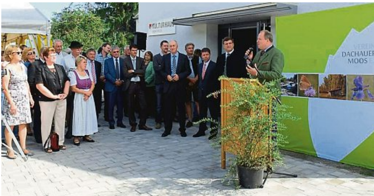
Das sanierte Kulturhaus wurde seiner Bestimmung übergeben.