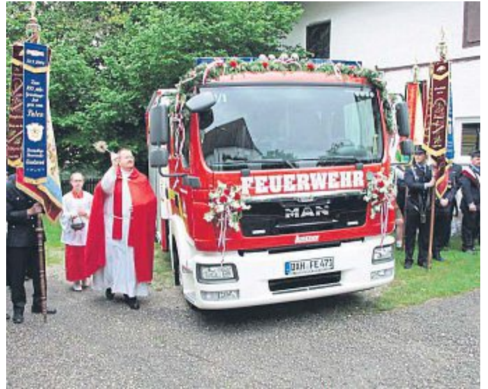
Das neue Löschfahrzeug der Feuerwehr Eisolzried.

■ Bauvorhaben: Der Umbau des Rathauses steht für das Jahr 2017 auf der Liste. Das Einwohnermeldeamt, das Standesamt, das