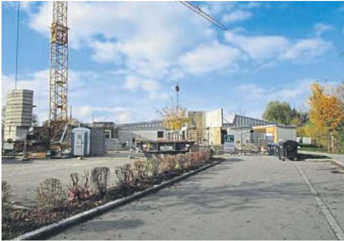
Der neue Anbau an die GADA-Kinderkrippe läuft bereits auf Hochtouren.

Fortsetzung von Seite 3 cke einspurig für den Verkehr freizugeben, war aus Platzgründen leider nicht möglich. Eigentlich sollte in diesem Mitteilungsblatt den Bürgern mitgeteilt werden, dass die Brücke bereits Anfang Dezember für den Verkehr freigegeben wurde. Dies hat sich jedoch vor einigen Tagen zerschlagen, da sich herausgestellt hat, dass die Füllungen des Brückengeländers nicht passen. Es ist sehr bedauerlich, dass die Sperrung nun doch noch ein paar Tage länger dauern wird. Die Summe dieser ganzen Probleme hat letztendlich zu dieser langen Verzögerung geführt, die für alle Betroffenen sehr unangenehm und lästig war. Wir haben Verständnis für die Verärgerung der Bürger, möchten aber nochmals betonen, dass die Gemeinde Bergkirchen nicht der Bauherr war. Wir haben lediglich den Geh- und Radweg im gleichen Zug mit bauen lassen.