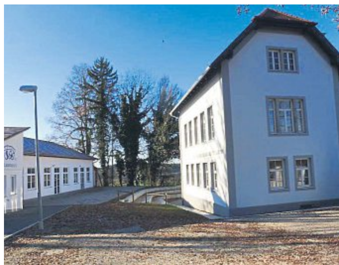
Die alte Schule Lauterbach.

Leider konnte die Brücke über die B 471 in Neuhimmelreich bisher immer noch nicht für den Verkehr freigegeben werden. Die Sanierung dieser Brücke, für die der Freistaat Bayern zuständig ist, war sehr viel aufwändiger als zunächst angenommen. Nach dem Entfernen der Brückenkappen und des Belages samt Abdichtungen hatte sich herausgestellt, dass die Brücke unnatürlich viele Risse hatte und dass die Bestandspläne aus dem Jahr 1971 nicht mit der Realität übereinstimmten. Also musste eine komplett neue Prüfstatik erstellt werden, was allein schon 8 Wochen in Anspruch nahm. In dieser Zeit konnte nicht weitergearbeitet werden. Nach Wiederaufnahme der Arbei-