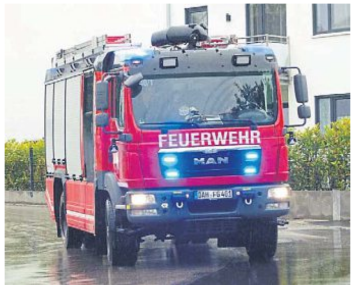
Das neue Löschfahrzeug der Feuerwehr Günding.

■ Straßen, Wege, Spielplätze, Kanalbau: Im neuen Jahr soll der Kanalbau in Neuhimmelreich starten. Damit sind nahezu alle Ortsteile ans Kanalnetz angeschlossen. In Palsweis soll an der St.-Urban-Straße ein Gehweg vom Bürgerhaus zur Kirche gebaut werden. Der Ausbau des Radwegenetzes in unserer Gemeinde ist ein langfristiges Ziel. Wenn die Grundstücksverhandlungen positiv verlaufen, kann hoffentlich auch im