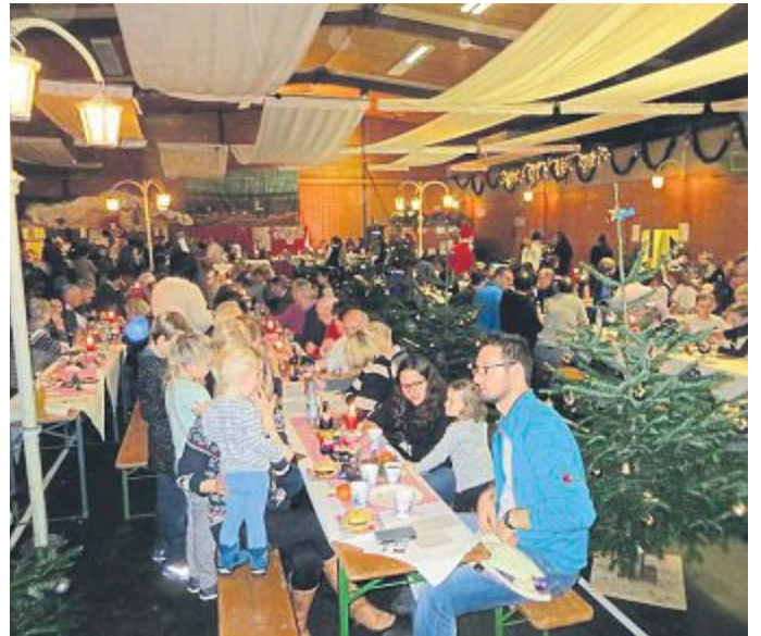
Weihnachtsmarkt in Günding.