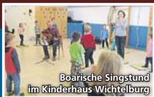
Boarische Singstunde im Kinderhaus Wichtelburg

hof inhaltlich neu überarbeitet und erweitert. Die Kinder des angrenzenden Kindergartens nahmen den Garten sogleich begeistert in Besitz und zeigten den eingeladenen Gästen, wie das geerntete Korn mit der Hand gedroschen werden kann und wo die dicksten Kürbisse wachsen. Bei Kürbissuppe und Flammkuchen aus dem Brotbackofen klang die Feier aus.