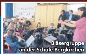
Bläsergruppe an der Schule Bergkirchen