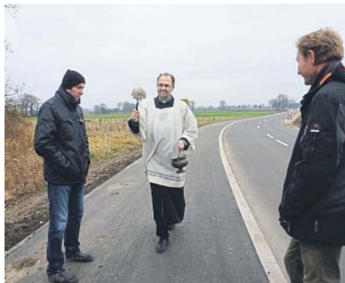
Segnung der Straße in Eisolzried.

Die Traglufthalle neben dem Gewerbegebiet GADA soll bis Ende Januar leer werden. Die Unterkunft in Gröbenried bleibt bis auf weiteres bestehen.