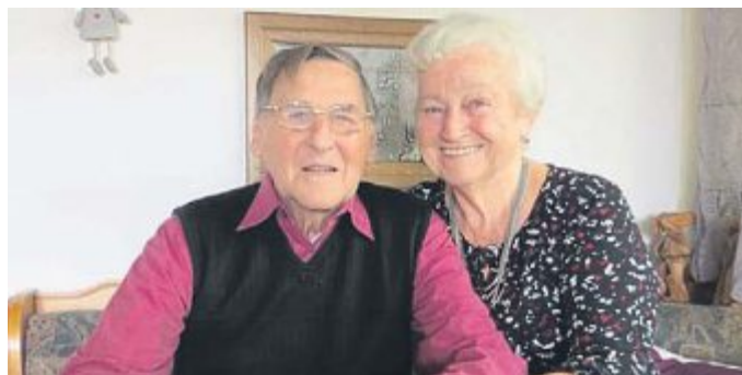
... und heute.