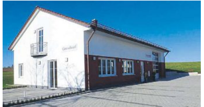
Das neue Feuerwehr- und Gemeindehaus Kreuzholzhausen.

Das Maschinenhaus des Wasserzweckverbandes in Oberbachern bekam einen neuen Fassadenanstrich, die Giebel wurden mit Blech verkleidet und die Außenanlagen neu hergerichtet.