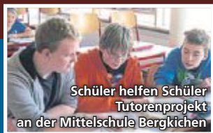
Schüler helfen Schüler Tutorienprojekt an der Mittelschule Bergkirchen