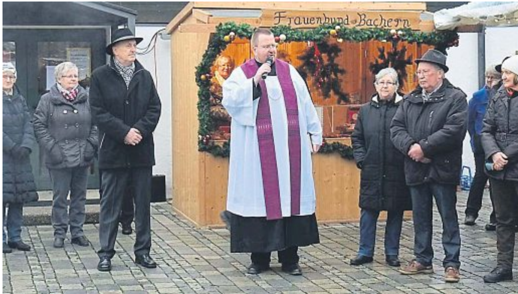
Adventsmarkt in Bergkirchen.