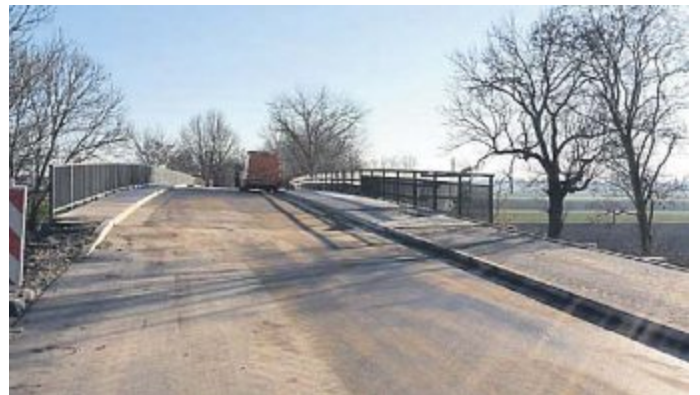
Brücke über die B 471.