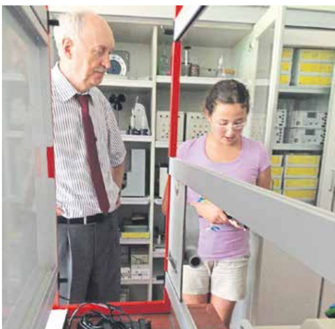
Hoch interessiert lauscht der Bürgermeister den Erklärungen der Schülerin.

Motto von Konfuzius (553-473 v. Chr): „Erzähle mir und ich vergesse. Zeige mir und ich erinnere mich. Lass es mich tun und ich verstehe.“ - Dürfen sich die Schülerinnen und Schüler nun dank ihrer MINT AG, dem Engagement der betreuenden Lehrkräfte und der Unterstützung von externen Experten auf spannende und forschende Physikstunden im kommenden Schuljahr freuen. A. WINCKLER/E. REHM