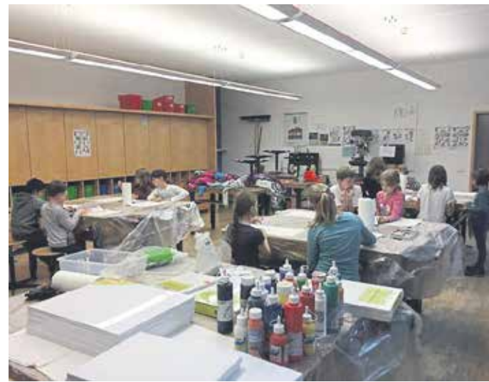
... und Acryl malen.