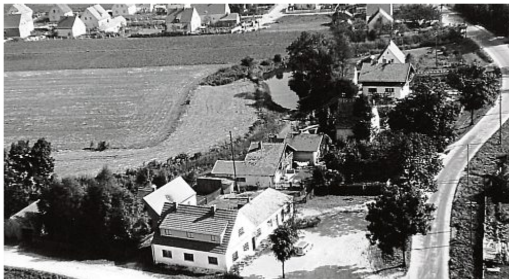
Günding 1956 Kreuzung Brucker Straße - St.-Vitus-Straße

1. wer vorsätzlich oder fahrlässig entgegen § 1 Absatz 1 einen Kampfhund oder großen Hund nicht an der Leine führt oder einen Kampfhund oder großen Hund auf Kinderspielplätzen mitführt oder 2. wer vorsätzlich oder fahrlässig entgegen § 1 Absatz 2 einen Kampfhund oder großen Hund an einer nicht reißfesten oder an einer mehr als drei Meter langen Leine führt.