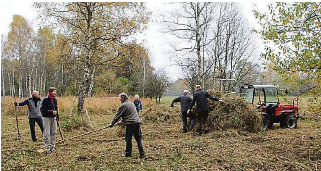
Landschaftspflege im Palsweiser Moos: Auf den feuchten Pfeifengraswiesen muss das Gras von Hand gerecht und zusammengetragen werden

im Palsweiser Moos unterwegs. Die Pfeifengraswiesen werden mit Freischneidern und Balkenmähern gemäht. Auf den Flächen des BUND Naturschutz wird das Gras von ehrenamtlichen Helfern gerecht und aufgeladen. Auf einer großen Heugabel an einem Schlepper wird es zur Sammelstelle gefahren. Dort holt es ein Landwirt ab. Weitere Infos unter www.palsweiser-moos.de .