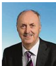
Simon Landmann Erster Bürgermeister

Im September hat das neue Schuljahr begonnen und ich hoffe, unsere ABC-Schützen haben sich schon einigermaßen an den Schulalltag gewöhnt. Auch in unseren Kinderbetreuungseinrichtungen haben die vielen kleinen