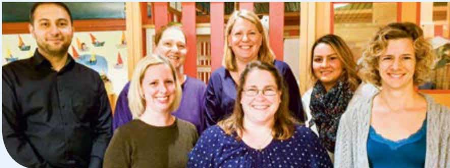
Der Elternbeirat des Kinderhauses Pustebblume

Text: Michaela Wanner