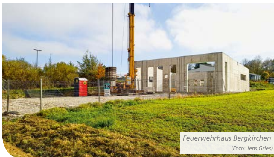
Feuerwehrhaus Bergkirchen