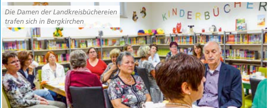
Die Damen der Landkreisbüchereien trafen sich in Bergkirchen