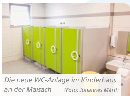
Die neue WC-Anlage im Kinderhaus an der Maisach

Im Kinderhaus an der Maisach wurde die komplette WC Anlage erneuert. Für das nächste Frühjahr ist ein Erweiterungsbau für zwei Krippengruppen in Günding geplant.