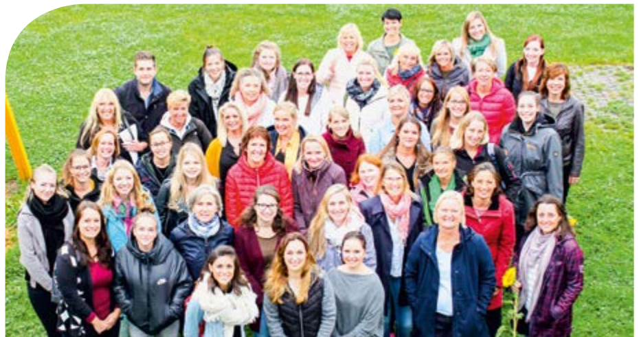
Fast 50 Mitarbeiter/innen umfasst das Team der Kinderbetreuungseinrichtungen der Gemeinde Bergkirchen

Wir freuen uns auf die gemeinsame Zeit mit allen neuen und alten Mitarbeitern/innen und natürlich vor allen Dingen mit den vielen Kindern und ihre Familien! Text und Foto: Iris Hille-Lüke