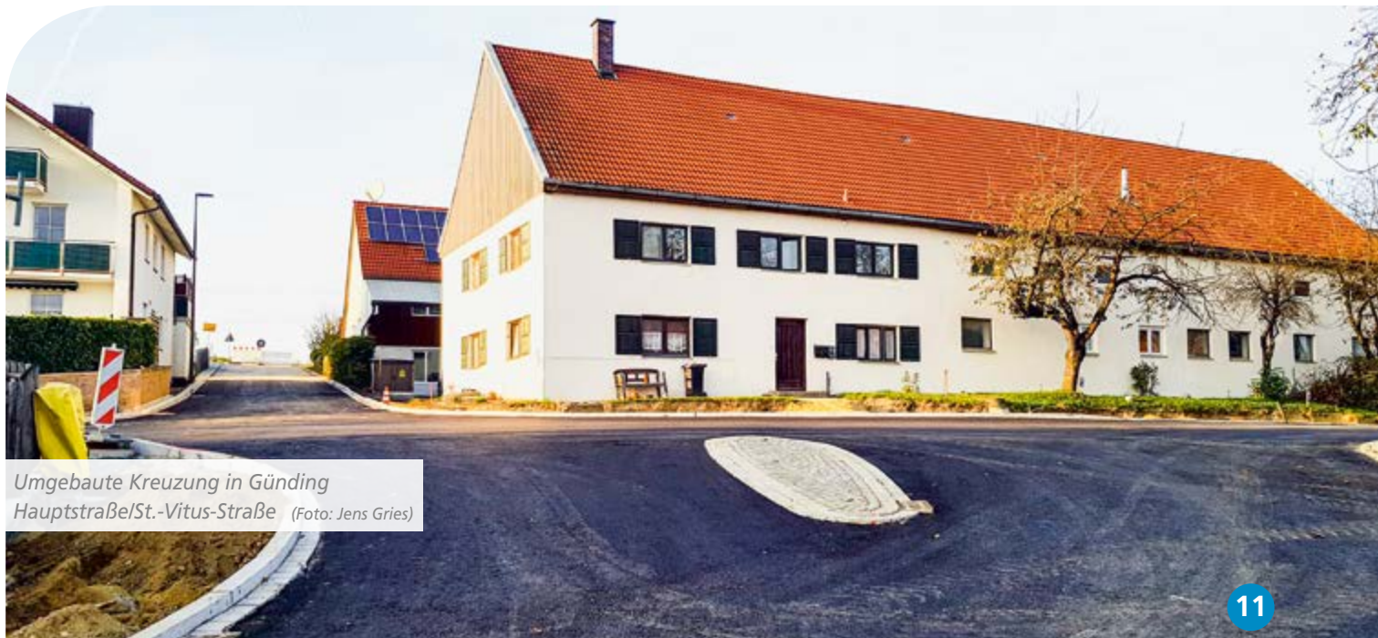
Umgebaute Kreuzung in Günding Hauptstraße/St.-Vitus-Straße