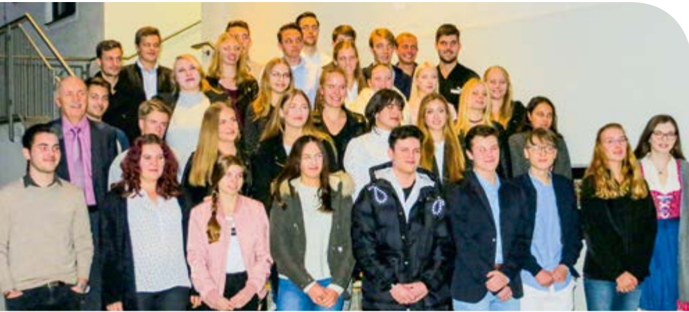
Die erfolgreichen Schul- und Berufsabsolventen aus der Gemeinde Bergkirchen