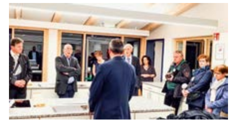
Die neue moderne Schulküche für den Hauswirtschaftsunterricht

Zusätzlich gibt es noch eine bestuhlte und teilüberdachte Außenfläche für ca. 72 Personen, damit die Kinder bei schönem Wetter auch draußen essen können. Das Gebäude entspricht selbstverständlich den aktuellen energetischen