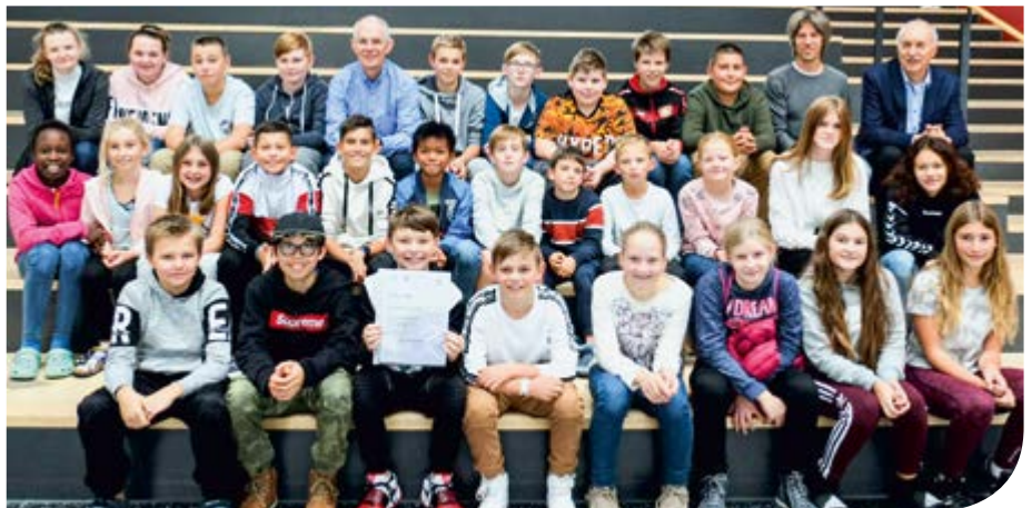
Die mitgeradelten Schüler der Mittelschule bei der Urkundenverleihung

Auch die Bürger der Gemeinde Bergkirchen sind kräftig ins Pedal getreten. In den drei Wochen wurden 15.065 km geradelt. Dadurch ergab sich eine CO 2 Vermeidung von 2.139 kg. Dieses Ergebnis wurde durch private, wie auch beruflich geradete Kilometer gesammelt. Die Kampagne STADTRADELN dient der Förderung des „Null-Emissions-Fahrzeugs“ Fahrrad im Straßenverkehr mit dem Ziel u. a. Luftschadstoffe und Lärm zu reduzieren und folglich die Lebensqualität in