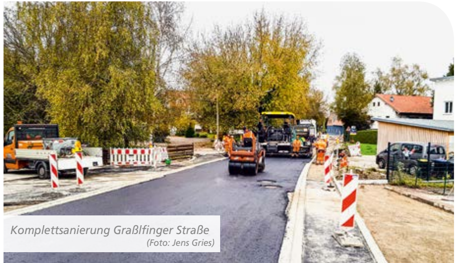
Komplettsanierung Graßlfinger Straße

Der obere Teil der Bergkirchner Kirchentreppe wurde kürzlich komplett erneuert. Im Moment fehlen noch die Handläufe. Die Sanierung des unteren Teils