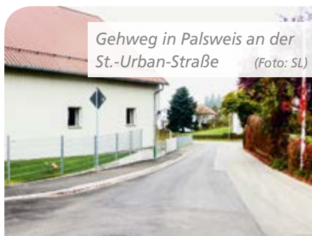
Gehweg in Palsweis an der St.-Urban-Straße