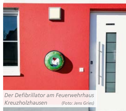
Der Defibrillator am Feuerwehrhaus Kreuzholzhausen

Im Sommer begann der Bau des Feuerwehrhauses Bergkirchen, dessen Fertigstellung für das Frühjahr 2020 geplant ist. Das Feuerwehrhaus Feldgeding soll im nächsten Jahr einen Anbau erhalten. Die Gemeinde hat unzählige Gebäude, die ständig instandgehalten werden müssen. Die Feuerwehrhäuser Günding und Lauterbach sowie der Jugendraum in Günding erhielten einen neuen Anstrich und der Hochbehälter des Wasserzweckverbandes Oberbachern wurde innen und außen gemalt und die Zaunanlage erneuert.