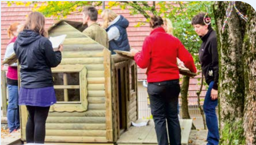
Viele fleißige Hände bauten das Gartenhäuschen für die Krippenkinder auf

Wer will fleißige Handwerker sehn, der muss in die Krippe gehen... Nachdem im Frühjahr der vordere Garten, welcher hauptsächlich von den Kin-