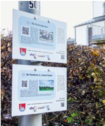
So schauen die „Hörpfade-Schilder“ aus