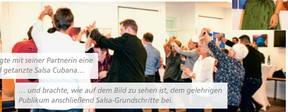
... und brachte, wie auf dem Bild zu sehen ist, dem gelehrigen Publikum anschließend Salsa-Grundschrirte bei.