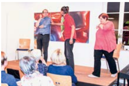
Das Impro-Theater Geh5