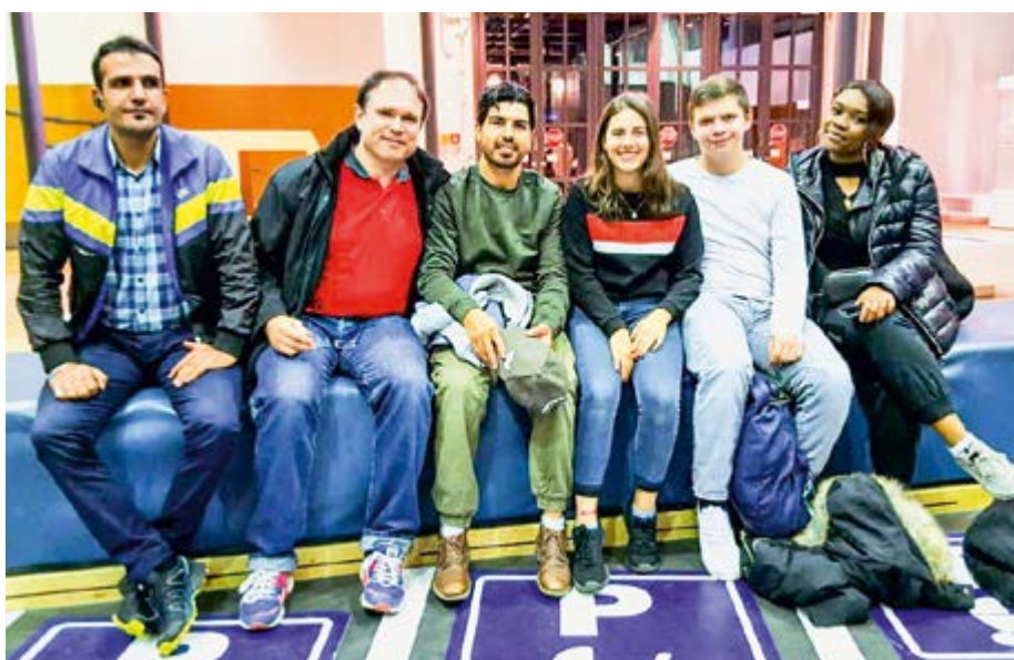
Zusammen sprechen wir viele Sprachen fließend: Farsi/Dari, Deutsch, Englisch, Italienisch, Französisch und Lingála

Alltag sind solche Ausflüge nicht. Die meisten unserer Asylbewerber arbeiten lange oder sind in Ausbildung und Schule. Mit unseren Projekten können wir