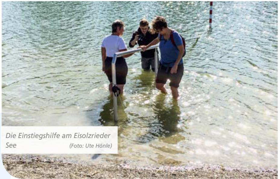
Die Einstiegshilfe am Eisolzrieder See

Ein größeres Straßenbauprojekt hat der Landkreis Dachau in Angriff genommen. Die gefährliche Kreuzung in Günding an der Hauptstraße zur St.-Vitus-Straße (beim Maibaum) wurde