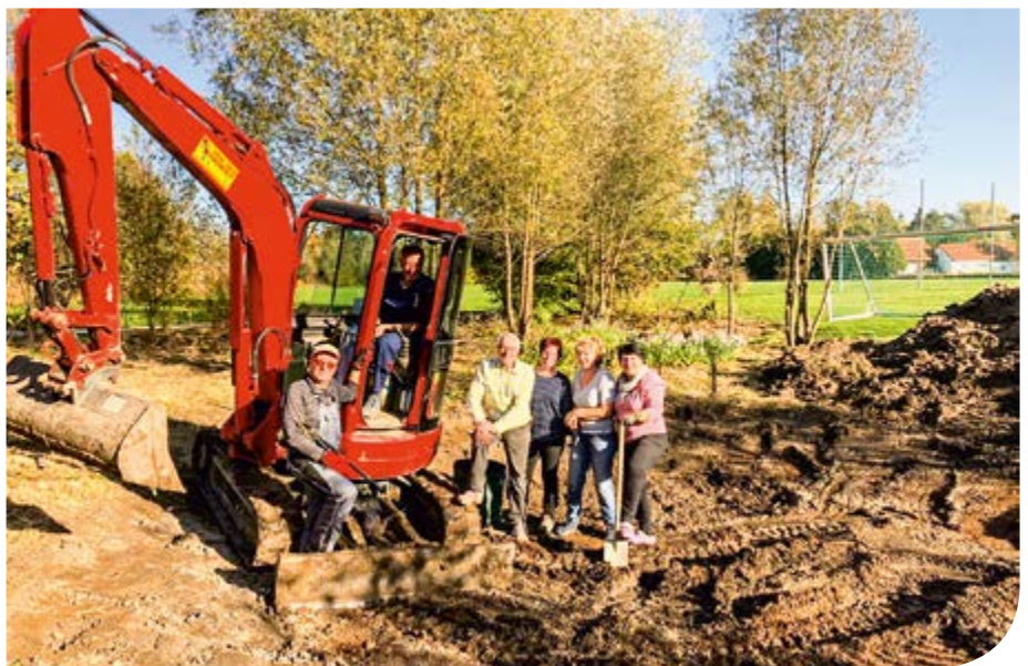
Die fleißigen Helfer des Gartenbauvereins Günding beim Anlegen des Maisachbiotopes

Text: Robert Rossa, Verein Dachauer Moos e.V., Foto: Hubert Kranz