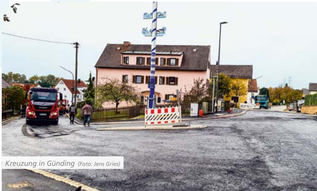
Kreuzung in Günding