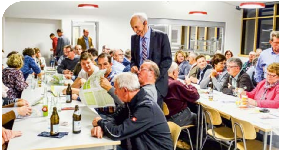
Bürgerversammlung in der neuen Schulmensa

Mensa kaum ausreichte. Wünsche und Anträge aus den Bürgerversammlungen werden innerhalb von 3 Monaten im Gemeinderat behandelt.