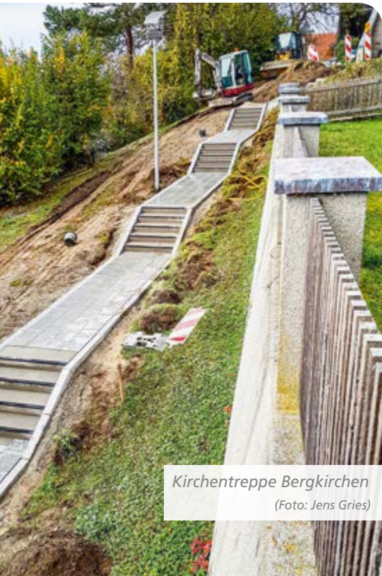
Kirchentreppe Bergkirchen

Der musikalische Theatersommer Bergkirchen ging mit Shakespeares Komödie „Ein Sommernachtstraum“ ins fünfte Jahr. Erstmals fanden die meisten Aufführungen unter freiem Himmel statt. Nur selten musste in die Lauterbacher Sporthalle ausgewichen werden. Das Ensemble des Hoftheaters Bergkirchen und das Petershausener Kammerorchester gaben ihr Bestes. Auch für 2020 wird von der Agenda-Gruppe „Kultur- und Begegnung“ wie-