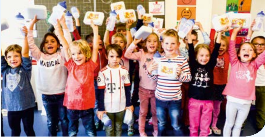
Die Schüler freuten sich über die Brotboxen und Trinkflaschen