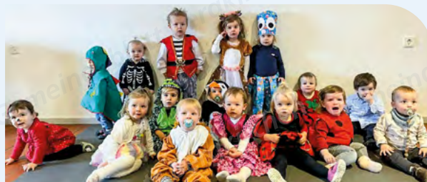
Ein lustiger Faschings-Vormittag im Kinderpark