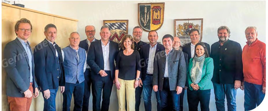
Austausch zwischen WestAllianz und NordAllianz.