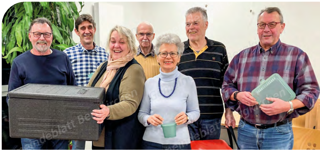
Die Fahrerinnen und Fahrer für den mobilen Mittagstisch.