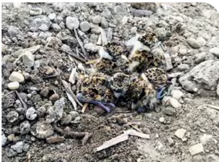
Kiebitzküken im Nest

Leider lässt sich der markante Ruf der Kiebitze immer seltener vernehmen, nachdem der Bestand in den letzten Jahrzehnten deutschlandweit um circa 90 % zurückgegangen ist. Wenn die Vögel, die bis zu 20 Jahre alt werden, keine Küken mehr großziehen können, erlöschen die Vorkommen. Die Gründe für fehlenden Nachwuchs sind vielfältig: Brutgebiete werden durch Bebauung kleiner, Wandel in der Landschaft und Bewirtschaftung haben die Lebensbedingungen des Kie-