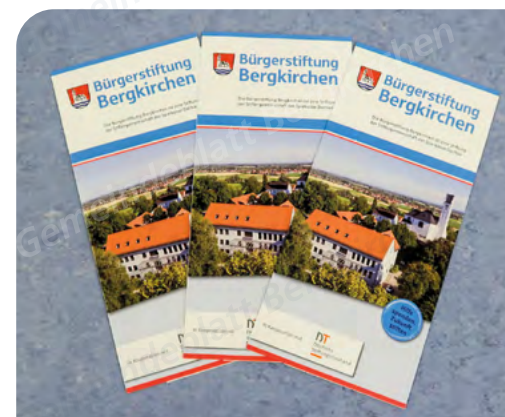
Text und Foto: LT

Achtung: Die Bürgerstiftung hat ab sofort eine neue Bankverbindung: IBAN: DE24 7005 1540 0281 0452 60 BIC: BYLADEM1DAH