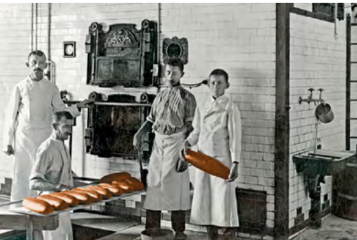
Backstube der Bäckerei Reim in Dachau, um 1918