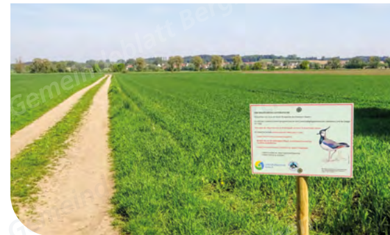
Der Landschaftspflegeverband bittet Spaziergänger auf den Wegen zu bleiben.

Der Landschaftspflegeverband und die beteiligten Landwirte bitten Sie deshalb herzlich, dass auch Sie Ihren Beitrag zum Erhalt dieses besonderen Gemeindebewohners leisten. Beachten Sie bitte zwischen 1. März und 31. Juli diese Verhaltensregeln in der freien Landschaft: