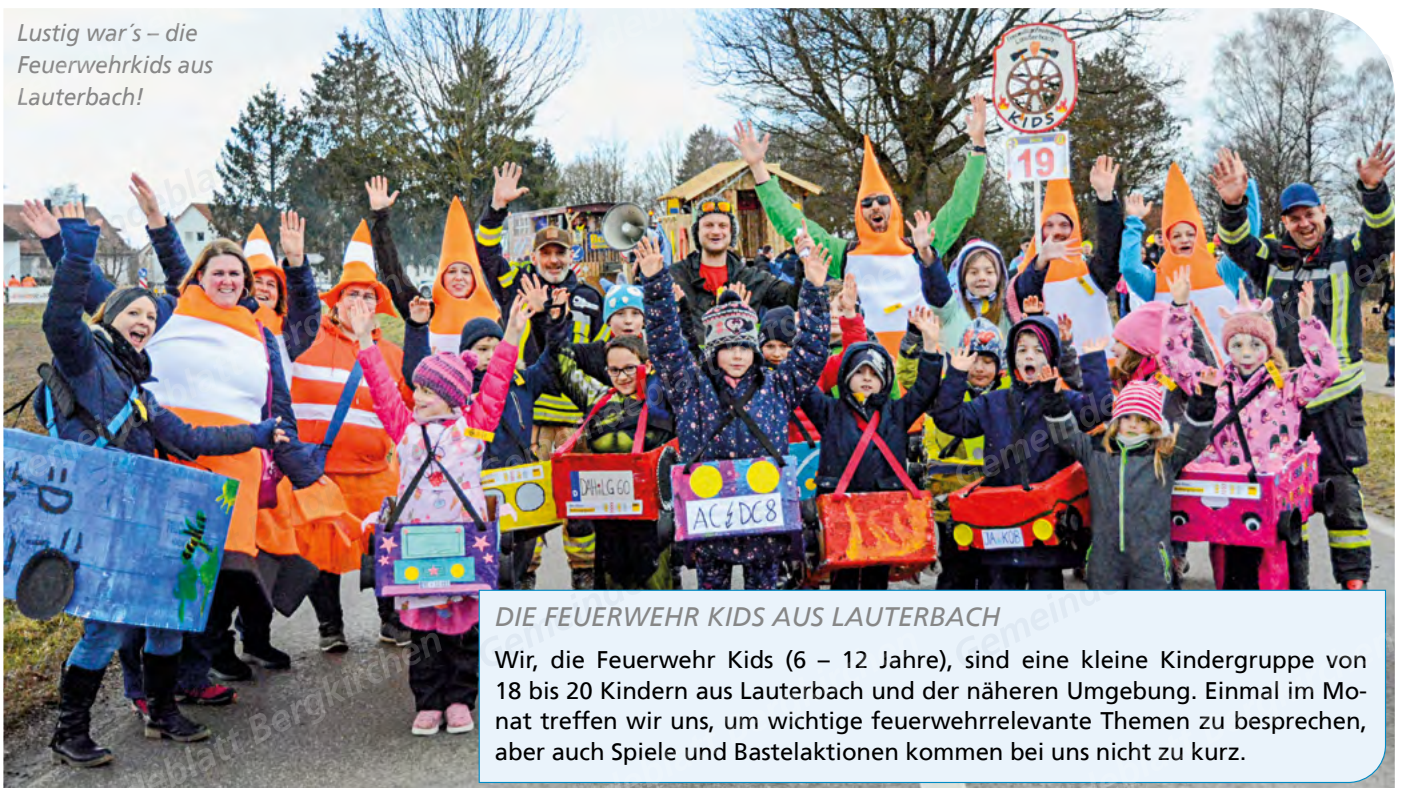
Lustig war's – die Feuerwehrkids aus Lauterbach!