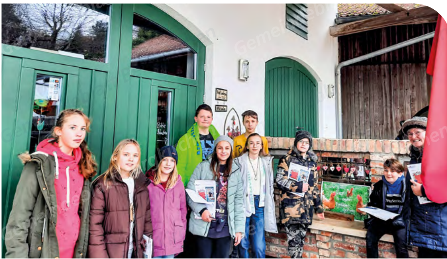
OGS-Bergkirchen besuchte den Bio-Hof Weller.

Text und Foto: Manuela Wendt und Beatrice Weiner