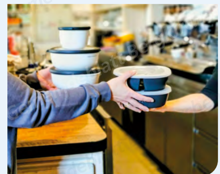
Mehrwegverpackung für Speisen