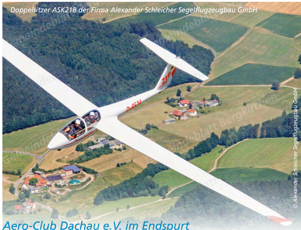
Doppelsitzer ASK21B der Firma Alexander Schleicher Segelflugzeugbau GmbH