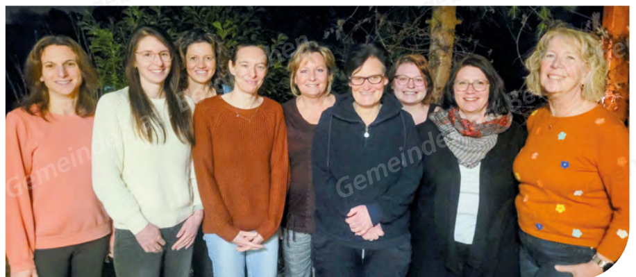
Die neue Vorstandschaft des Gartenbauvereins Feldgeding.