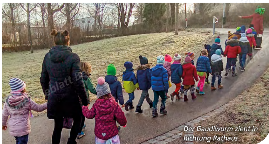
Der Gaudiwurm zieht in Richtung Rathaus.

Fasching ist immer was Besonderes und eine aufregende Zeit im Kinderhaus. In allen Räumen findet man lustig verkleidete und fröhlich geschminkte Kinder. Quatsch-Lieder und spaßige Reime bestimmen den Morgen- oder Mittagskreis. Krapfen und Süßigkeiten gehören ebenfalls dazu, genau wie der Auftritt der Faschingsgarde. In diesem Jahr tanzte zum ersten Mal im Kinderhaus die Kindergarde des Karlsfelder „Olympia-