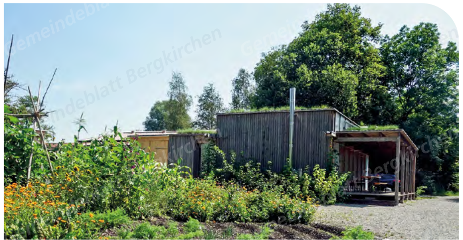
Ort vieler unserer Veranstaltungen: Das Umwelthaus Dachauer Moos am Obergrashof.

Natürlich sind auch die beliebten Brotbackkurse sowie verschiedene kultur- und landschaftsgeschichtliche Radltouren und Fotokurse wieder dabei. Familien mit Kindern können erfahren, wie man sich klimabewusst gesund ernährt und sich bei den Naturerlebnistagen „Im Moos nix los?“ auf die Spuren der Torfstecher und deren Familien begeben. Höhepunkt des Vereinsjahres ist das Jubiläumsfest zum 20jährigen Bestehen des Umwelthauses Dachauer Moos am Freitag, den 7. Juli am Obergrashof. Hierzu laden wir Sie jetzt schon herzlich ein.